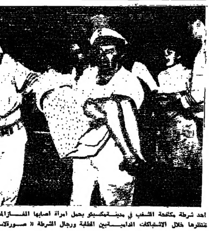
أحد شرطة مكافحة الشغب في مدينةمكسيكو يحمل امرأة أصابها الغاز المسيل للدموع الى سيارة اسعاف

وقال الناطق ان القوات الجوية... قيران جماعيان - وقال الناطق ان هوي مدينة بحرية في عملة السوفيت... قتل أسرى